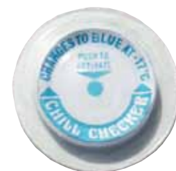
TL-CC / -17C, 图片为实际尺寸。