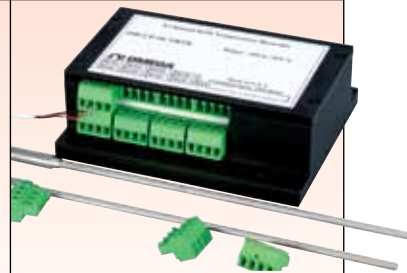
OM-CP-OCTRTD 8通道 数据记录器，请访问 omega.com/om-cp-octrtd