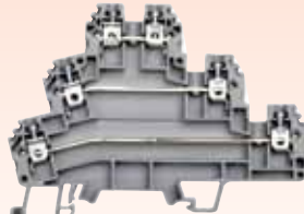
PUK-2T-10PK DIN导轨 接线端子，10件装，请参见 omega.com/terminal-blocks