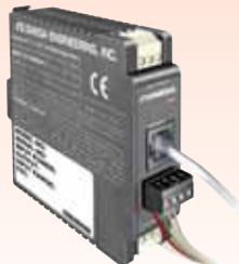
IDRN-RTD数字信号调节器， 请访问 omega.com/idrn-idrx