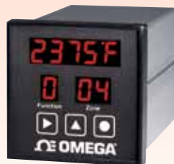
CN606RTD3 6-区 1/4 DIN温度监测