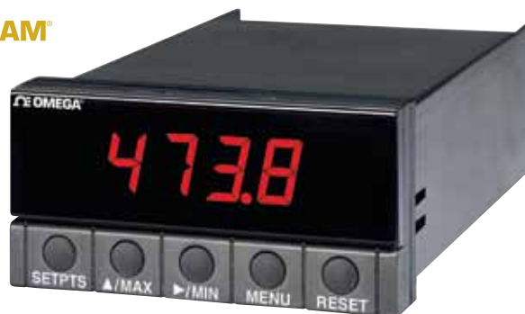
DP25B-E，图片小于实际尺寸。