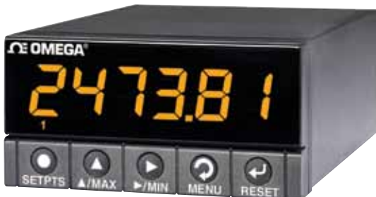
DP41-B，图片小于实际尺寸。