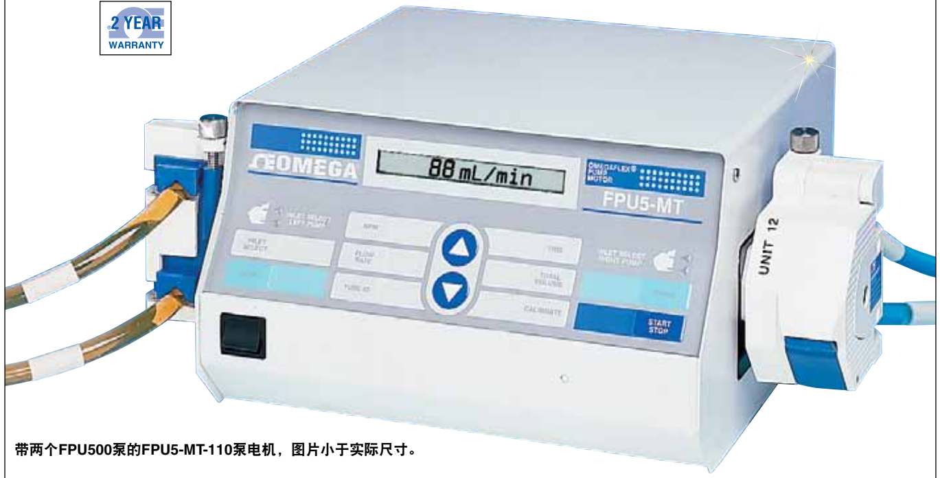
带两个FPU500泵的FPU5-MT-110泵电机，图片小于实际尺寸。