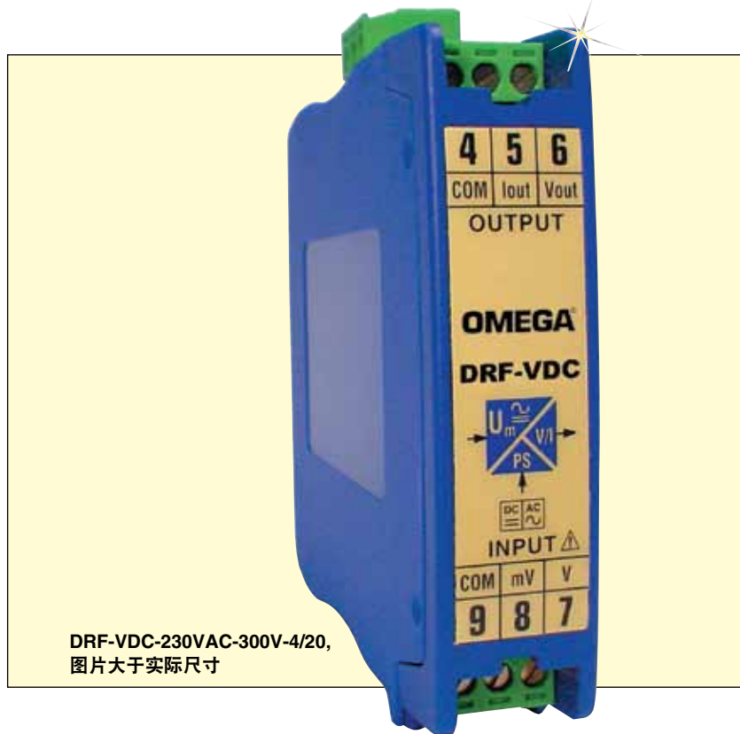
DRF-VDC-230VAC-300V-4/20, 图片大于实际尺寸