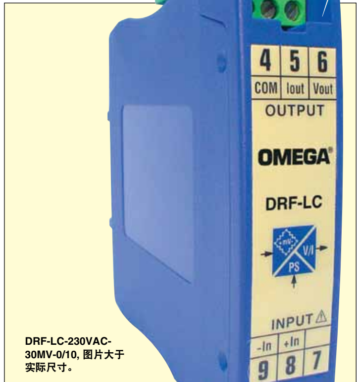
DRF-LC-230VAC-30MV-0/10, 图片大于实际尺寸。