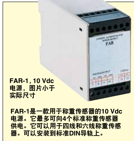
FAR-1, 10 Vdc 电源, 图片小于实际尺寸

FAR-1是一款用于称重传感器的10 Vdc电源。它最多可向4个标准称重传感器供电。它可以用于四线和六线称重传感器。可以安装到标准DIN导轨上。